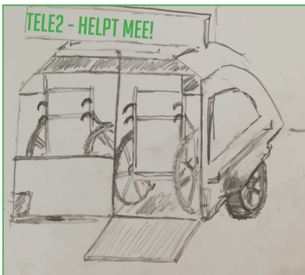
De Happy Helper - aanhanger

Deze middelen blijven eigendom van het platform. Fulltime chauffeurs zullen van zowel de lift als aanhanger een in eigen beheer krijgen. Bijverdieners zullen deze op basis van de planning doorroteren. Zo krijgen deze chauffeurs een melding of ze de middelen mogen bewaren tot hun volgende dienst of op het depot mogen komen afgeven.